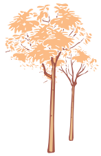
Schéma de la filière forêt-bois